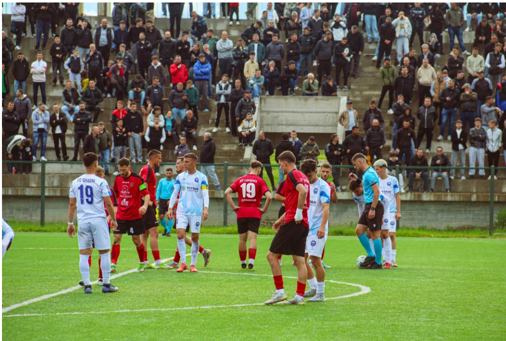
Figura 4. Ndeshje futbollit në stadiumin “Besnik Begunca”

Komuna e Kaçanikut posedon gjithashtu një trashëgimi të pasur, e cila përbën një vlerë të rëndësishme historike dhe kulturore. Për këtë arsye, prioritet do të vazhdojë të jetë mbrojtja, ruajtja dhe promovimi i trashëgimisë kulturore, si dhe zhvillimi i aktiviteteve kulturore që kontribuojnë në identitetin dhe promovimin e komunës.