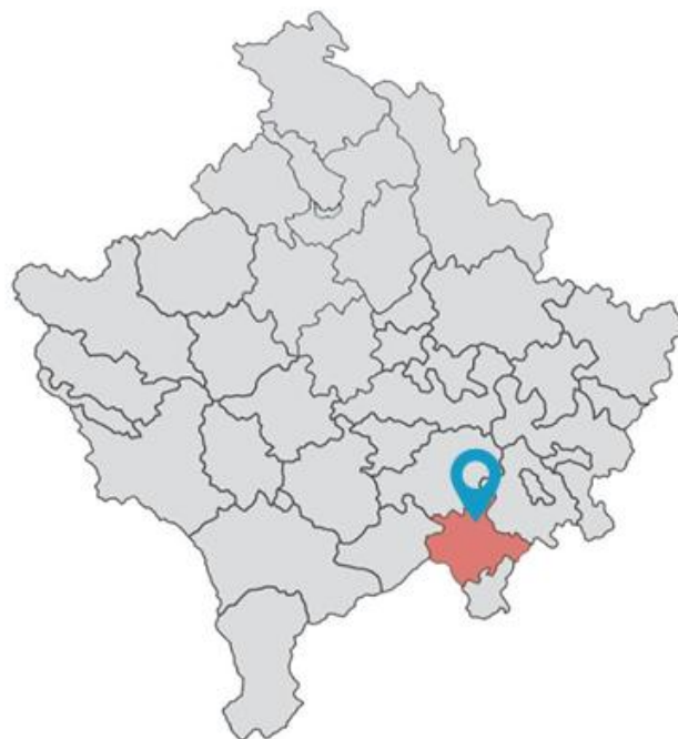
Figura 2. Pozita gjeografike e Komunës së Kaçanikut në Republikën e Kosovës.

Territori i Komunës së Kaçanikut karakterizohet nga reliev i larmishëm, që përfshin luginën e Lepencit dhe pjesë të maleve të Sharrit dhe Karadikut. Lartësia mbidetare shtrihet nga rreth 396 metra në luginën e Lepencit deri në 2,498 metra në Majën e Lubotenit, ndërsa territori përshkohet nga lumenjtë Lepenc dhe Nerodime. Këto veçori natyrore, së bashku me Grykën e Kaçanikut, Lubotenin dhe trashëgiminë kulturore e historike, krijojnë potencial për zhvillimin e bujqësisë, blegtorisë, pylltarisë dhe turizmit malor, rural, kulturor dhe rekreativ.