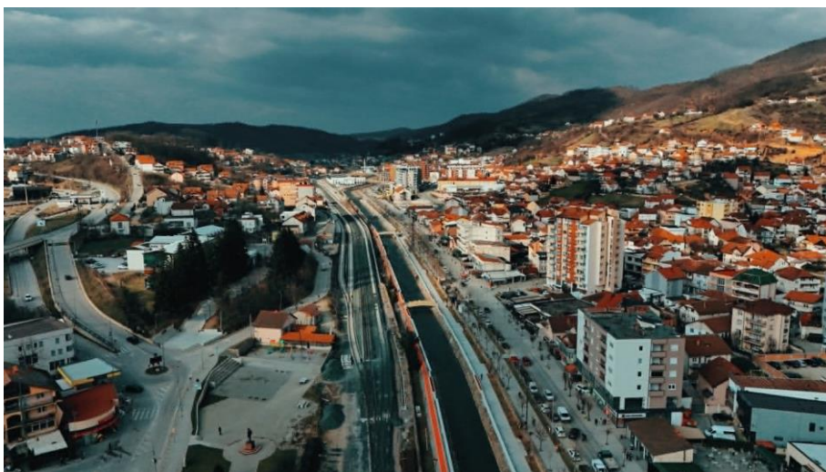
Figura 1. Kaçaniku