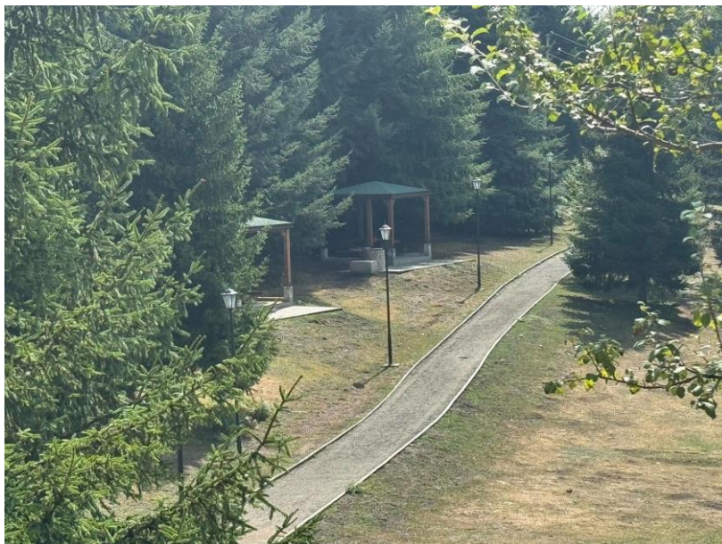
Figura 3. Parku rekreativ në fshatin Shtrazë

Komuna do të vazhdojë të mbështesë projektet për përmirësimin e infrastrukturës turistike dhe promovimin e resurseve natyrore e kulturore.